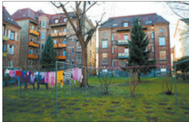
Waschtage in einem der malerischen Hinterhöfe