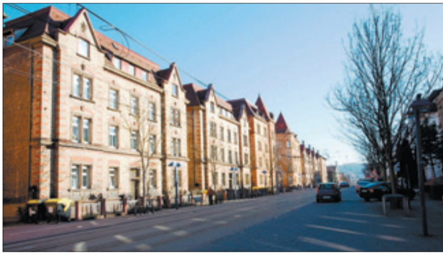
Wie eine Filmkulisse: Backsteinbauten in der Nordbahnhofstraße