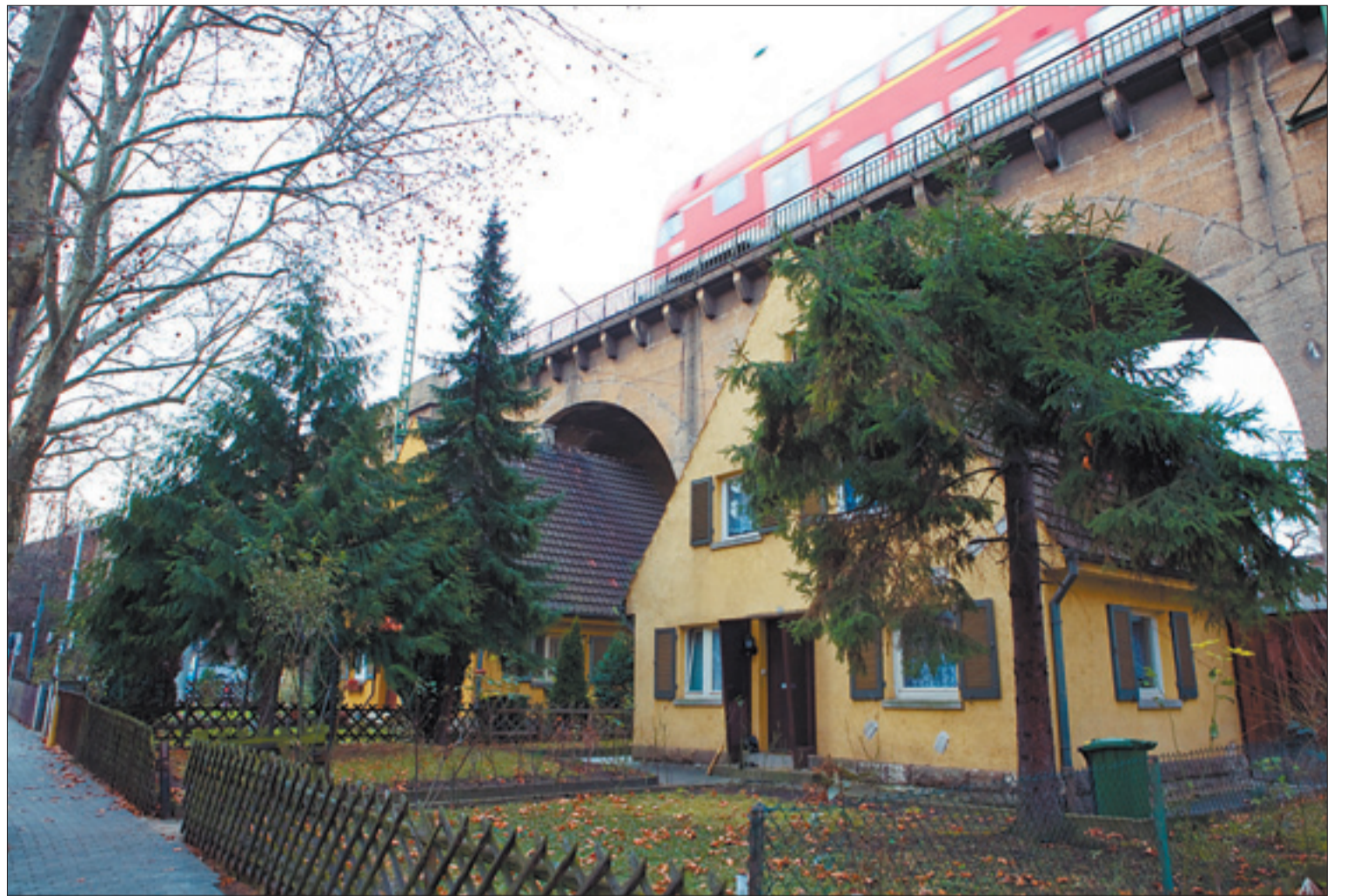
Wunderwelt Nordbahnhof: Wohnhäuser unter Brückenbögen der Bahn

Was bedeuten eingeschlagene Fensterscheiben am Stöckachplatz, warum kennen viele Stuttgarter das Leonhardsviertel nicht? Und warum verschwinden am Nordbahnhof die kleinen Läden? In unserer Reihe „Stadtquartiere“ unternehmen wir Streifzüge, reden mit Menschen über das Leben in ihren Vierteln. Haben Sie Anregungen zu Ihrem Stadtquartier? Schreiben Sie uns.