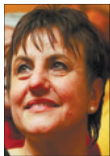
A. Krueger

Der neue Tiefbahnhof in der City ist auch im Nordbahnhof ein Thema. Doch was bringt