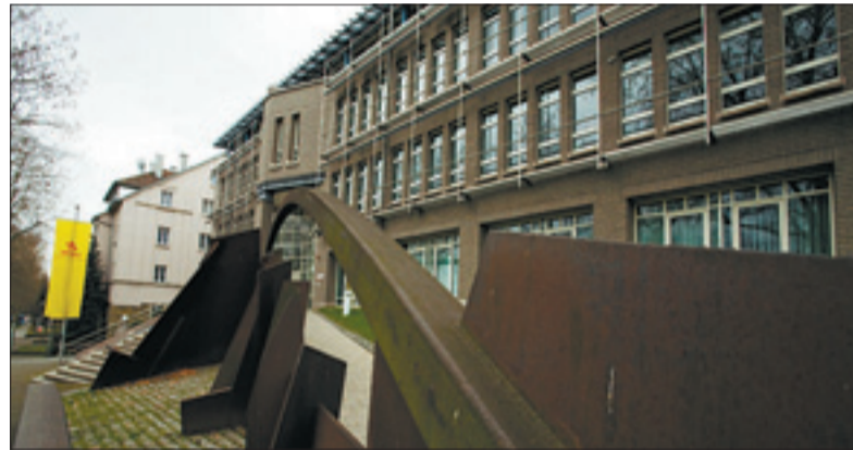
Modernes Architekturmonument Toto-Lotto-Zentrale